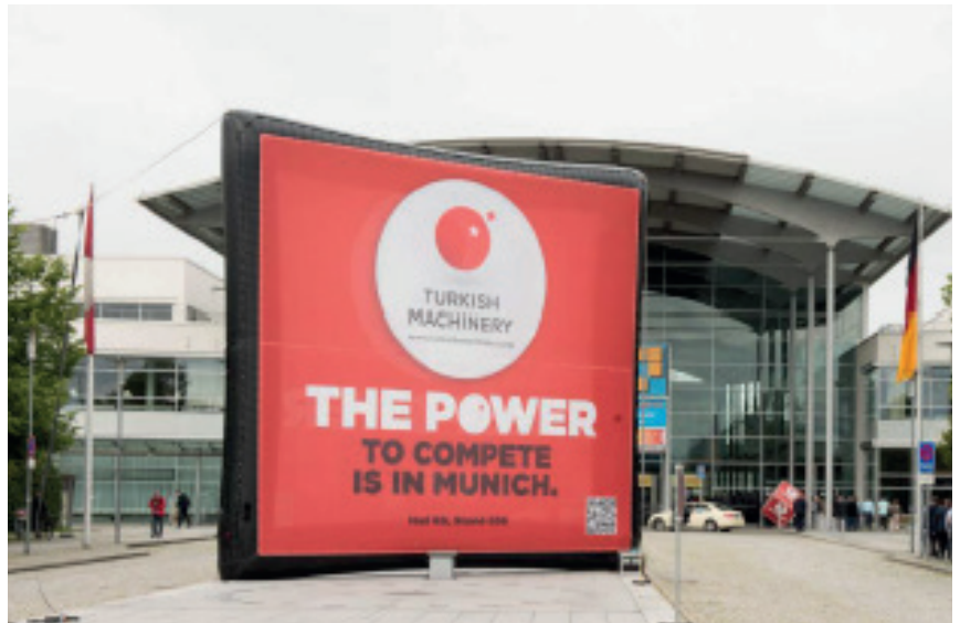
airframe® EASY 725

airframes® der EASY Serie benötigen im Gegensatz zur PRO Serie in der Regel keine dauerhafte Luftzufuhr und sind deshalb für Anwendungen im Gebäude noch besser geeignet.